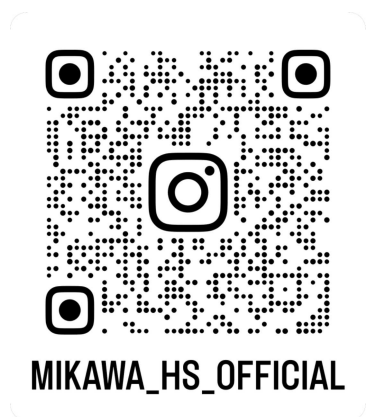
#三河変わった(インスタ)