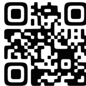
部活動応援宣言(ブログ)