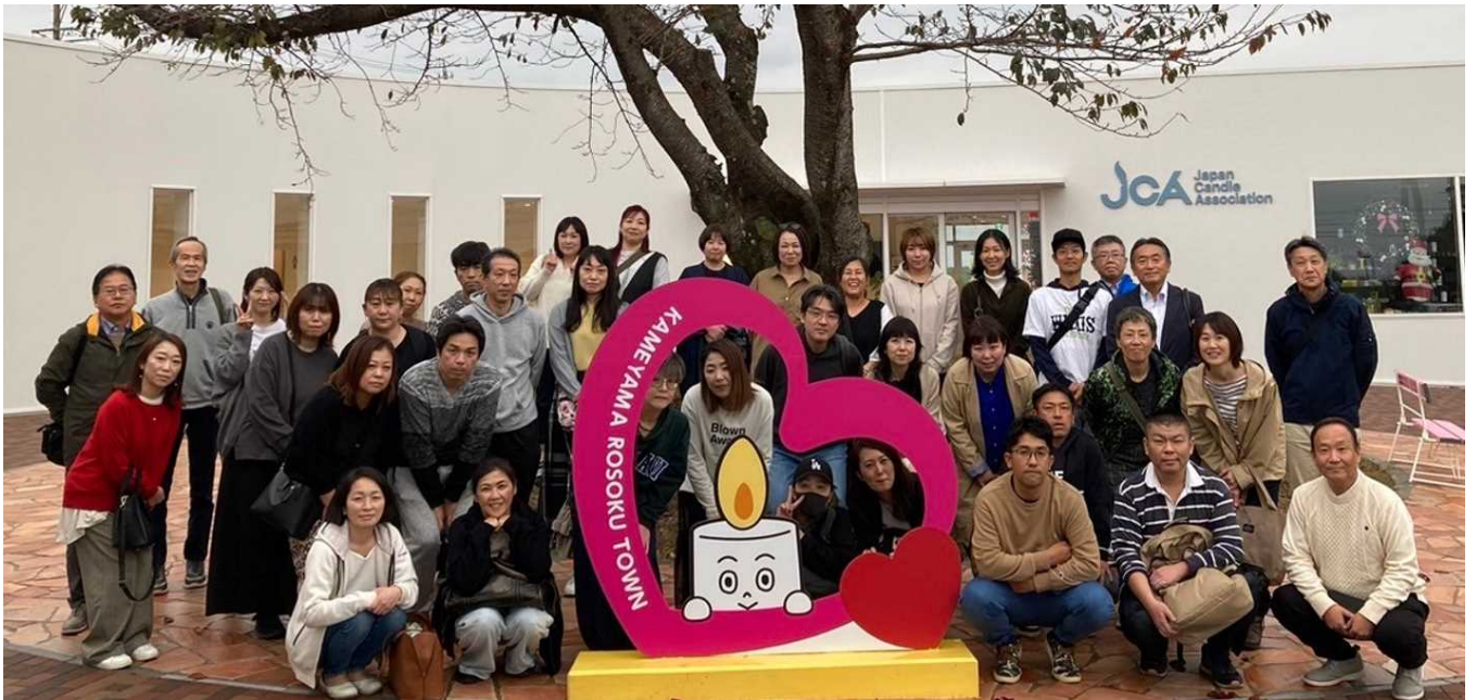
カメヤマローソクタウンにて