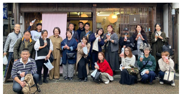
体験工房彩花里にて