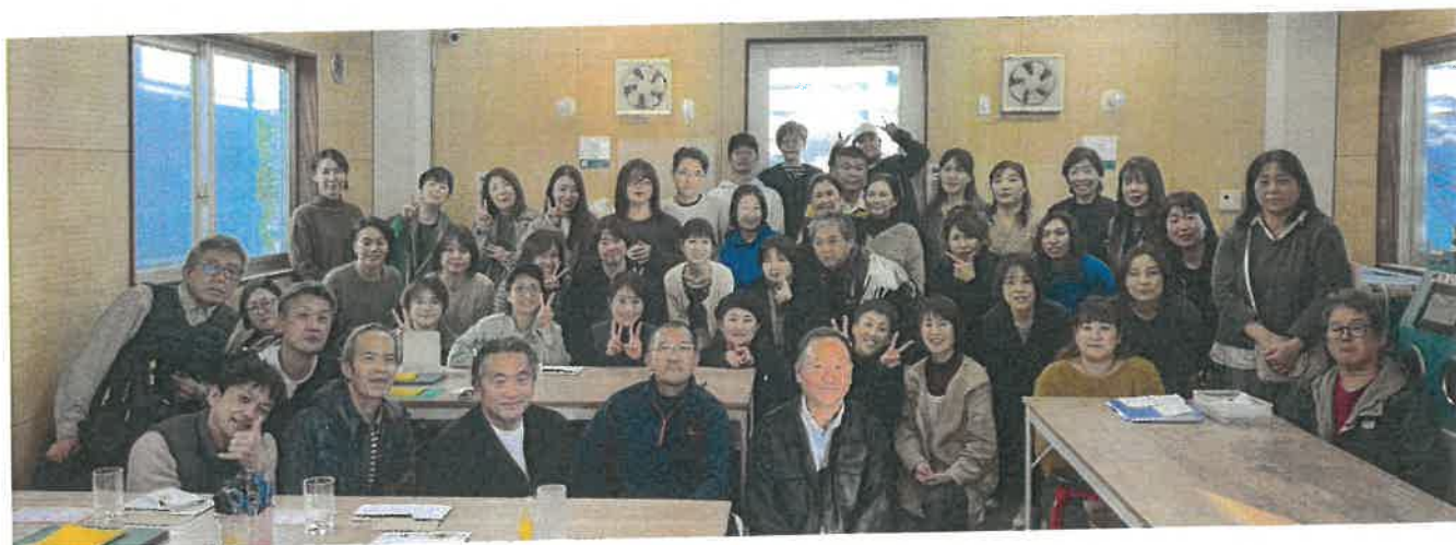
黒壁ガラス体験アトリエ ルディーク